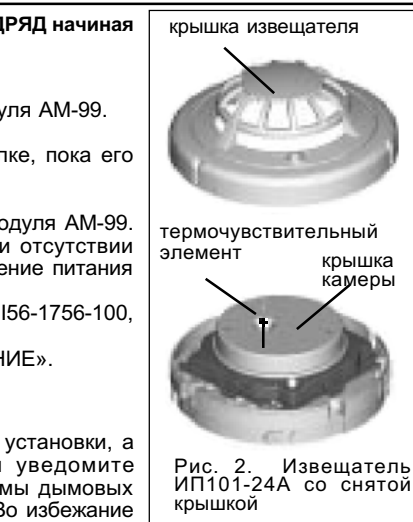
Рис. 2. Извещатель ИП1101-24А со снятой крышкой

При необходимости защиты извещателя от несанкционированного извлечения или для обеспечения надежного крепления при наличии вибрации перед установкой базы произведите операции в соответствии с указаниями на рис. 3. Для снятия извещателя после активизации функции защиты отверткой с узким плоским шлицем отожмите пластиковый рычаг к центру базы через прямоугольное отверстие между базой и извещателем.