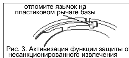
Рис. 3. Активизация функции защиты от несанкционированного извлечения